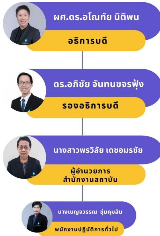
ภาพที่ 3 โครงสร้างการปฏิบัติงานของนักวิเคราะห์นโยบายและแผน ที่มา : ข้อบังคับสถาบันดนตรีกัลยาณีวัฒนาว่าด้วยการจัดตั้งและการแบ่งหน่วยงานภายใน ของสถาบันการบริหารงานและการกำหนดตำแหน่ง พ.ศ. 2568

โครงสร้างการปฏิบัติงานของพนักงานปฏิบัติการทั่วไปในสถาบันดนตรีกัลยาณีวัฒนา มีลักษณะเป็นหน่วยงานเชิงสนับสนุน ที่มุ่งเน้นการอำนวยความสะดวกแก่ภารกิจหลักของสถาบัน ดังแสดงในภาพที่ 3