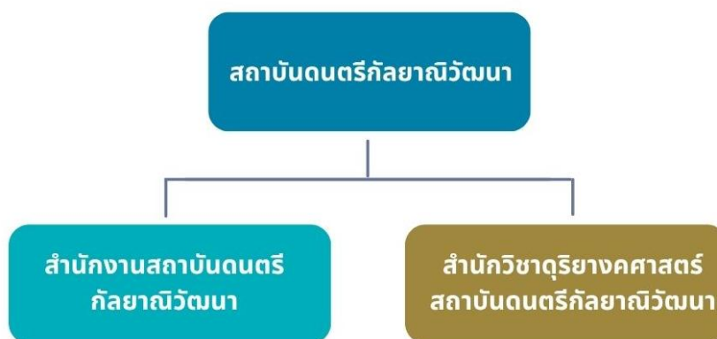
ภาพที่ 1 โครงสร้างองค์กรของสถาบันดนตรีกัลยาณีวัฒนา ที่มา : ประกาศสถาบันดนตรีกัลยาณีวัฒนาเรื่อง ส่วนงานของสถาบัน พ.ศ. 2555

ในปัจจุบัน สถาบันดนตรีกัลยาณีวัฒนา มีส่วนงานหลักตามประกาศสถาบันเรื่องส่วนงานของสถาบัน พ.ศ. 2555 แบ่งออกเป็น 2 ส่วนงาน ได้แก่ 1) สำนักงานสถาบัน ทำหน้าที่บริหารจัดการและสนับสนุนการดำเนินการตามวัตถุประสงค์ของสถาบัน รวมถึงภารกิจอื่นที่ได้รับมอบหมายจากสภาสถาบันและผู้บริหาร และ 2) สำนักวิชาดุริยางคศาสตร์ ซึ่งรับผิดชอบด้านการจัดการศึกษา การวิจัย การบริการวิชาการ และการทำนุบำรุงศิลปวัฒนธรรมอย่างครบวงจร ทั้งนี้ โครงสร้างดังกล่าวถูกออกแบบมาเพื่อให้สอดคล้องกับพันธกิจของสถาบัน และรองรับการเติบโตขององค์กรในระยะยาว ดังแสดงในภาพที่ 1