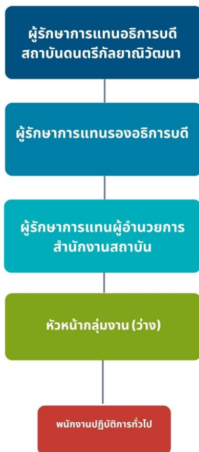
ภาพที่ 2 โครงสร้างการบริหารของสำนักงานสถาบัน

นอกจากนี้ ตามข้อ 7 ของข้อบังคับดังกล่าว ยังเปิดโอกาสให้สำนักงานสถาบันสามารถแบ่งโครงสร้างการทำงานภายในเพิ่มเติมในรูปแบบของ “กลุ่มงาน” ซึ่งทำหน้าที่สนับสนุนงานในด้านต่าง ๆ ของสำนักงาน โดยแต่ละกลุ่มงานจะมี หัวหน้ากลุ่มงาน ซึ่งแต่งตั้งจากพนักงานประจำของสถาบัน ทำหน้าที่เป็นผู้บังคับบัญชาและรับผิดชอบการดำเนินงานของกลุ่มงานนั้น ๆ เพื่อให้การบริหารงานมีประสิทธิภาพ คล่องตัว และตอบสนองต่อเป้าหมายของสถาบันในภาพรวมได้อย่างเหมาะสม ดังแสดงภาพที่ 2